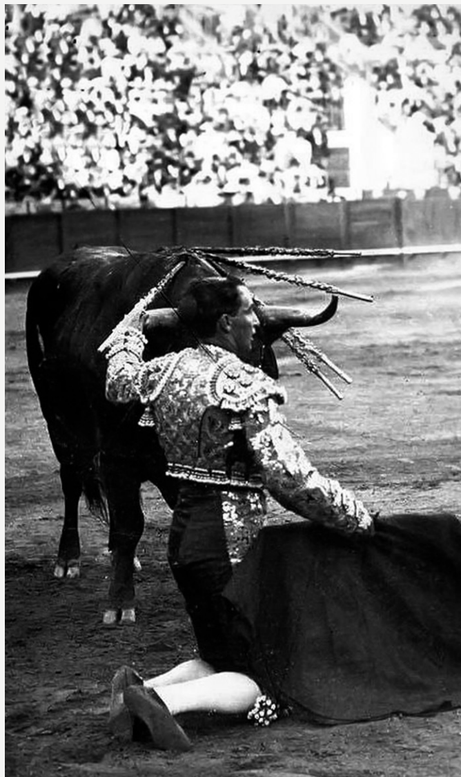
José Gómez Ortega "Gallito"

Así mismo, la Peña ha continuado con la publicación de diversos libros de interés taurino.